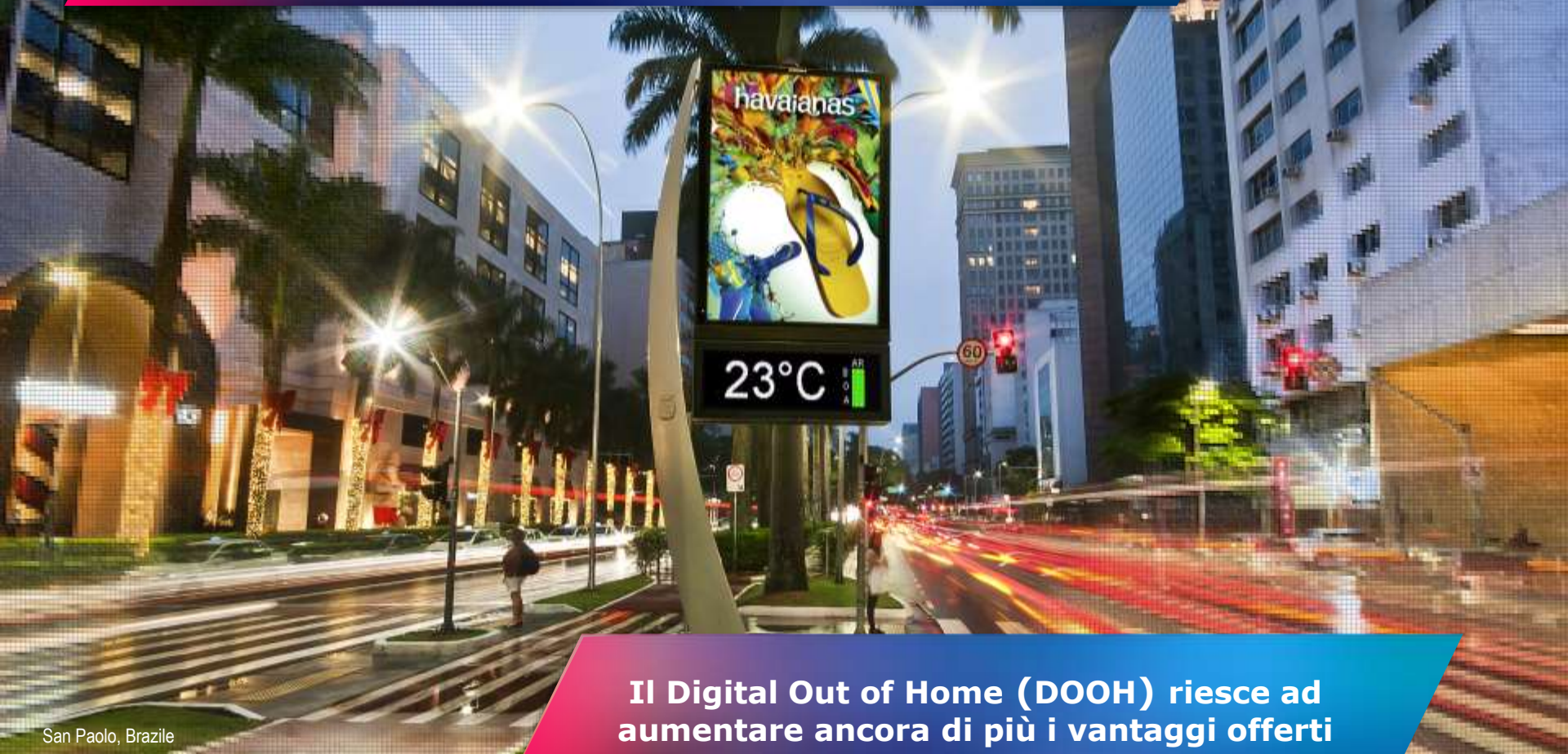
San Paolo, Brasile